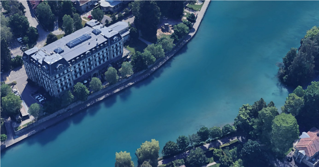
Location and surroundings for a new Aare crossing from the Panoramastrasse to the Aarequai in Thun