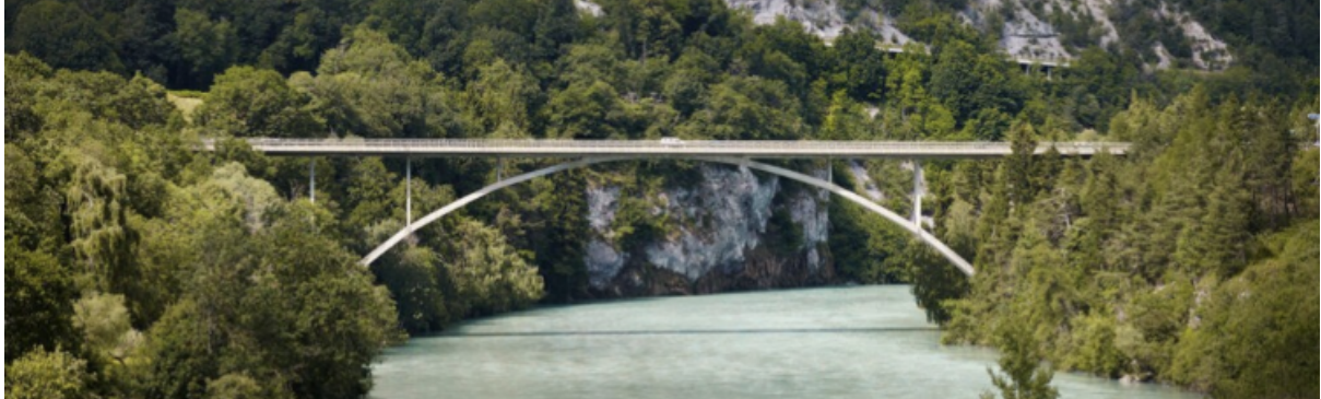
Blick von Süden auf die Rheinbrücke Tamins von Christian Menn Vue depuis le sud du pont du Rhin à Tamins de Christian Menn

Studierendenwettbewerb / Concours pour étudiants