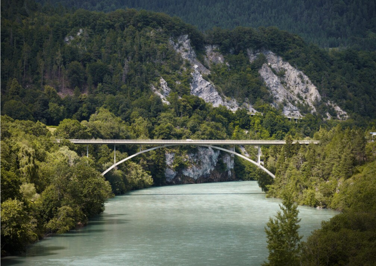
View from the south of the Rhine River bridge at Tamins by Christian Menn